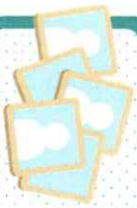
写真5枚無料キャンペーン

この度、児島マリンテールではご購入者のみなさまに写真をより簡単かつ便利にご購入いただくよう写真販売システム「クラプリ」を導入する運びとなりましたのでお知らせいたします。 指定期限まではご購入いただいた方は、写真5枚分が無料（半年間有効）でご購入いただけます。 この機会に是非ご購入くださいませ。